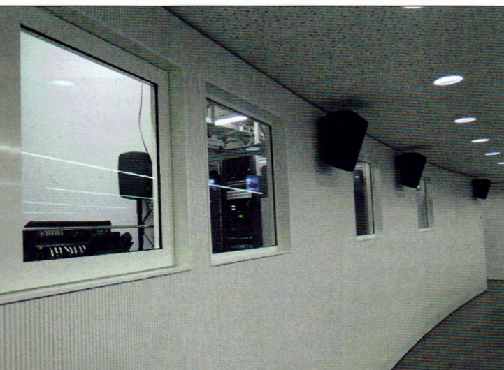
Die Projektoren sitzen hinter Glas.

Bespielt wird die Leinwand von 11,8 Metern Breite mit zwei Christie HD 14K-M 3DLP-Projektoren mit nativer HD-Auflösung (1920 x 1080 Pixel). Die >