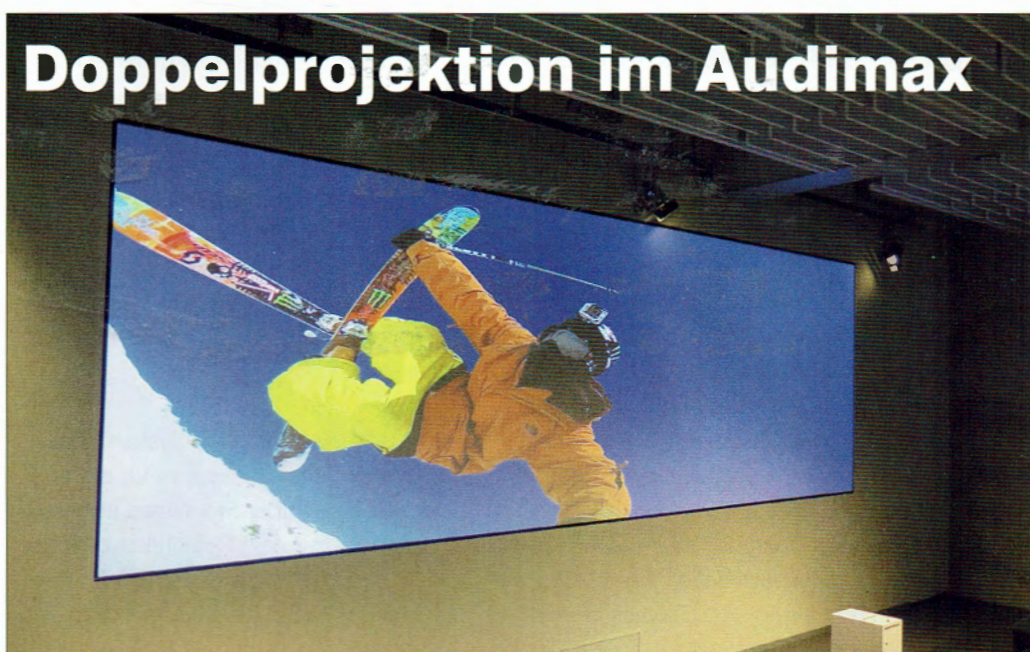
Die fast zwölf Meter breite Leinwand wird von zwei Christie HD 14K-M Projektoren bespielt.

Der Neubau der Hochschule auf dem Campus in Stuttgart-Vaihingen beherbergt unter anderem Büro- und Seminarräume, Hörsäle, TV- und Fotostudios, Audio- und Videolaboratorien, die Bibliothek und Rechnerpools. Im Audimax des neuen Gebäudes entstand hierbei eine